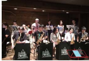
Pageone Jazz Orchestra -ページワンジャズオーケストラ-