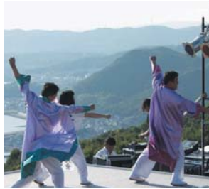
とこはい下津井節