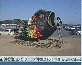
▲【宇野港】淀川テクニック「宇野コナタ」