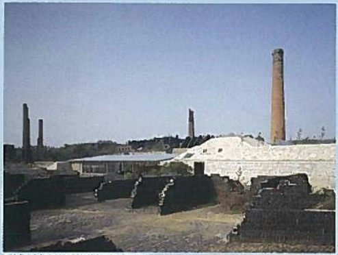
▲【犬島】犬島精錬所美術館