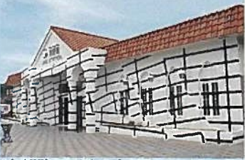
▲【R宇野駅】エステル・ストッカー「R宇野みなと線アートプロジェクト」