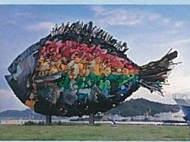
▲【宇野港】淀川テクニック「宇野のたま」