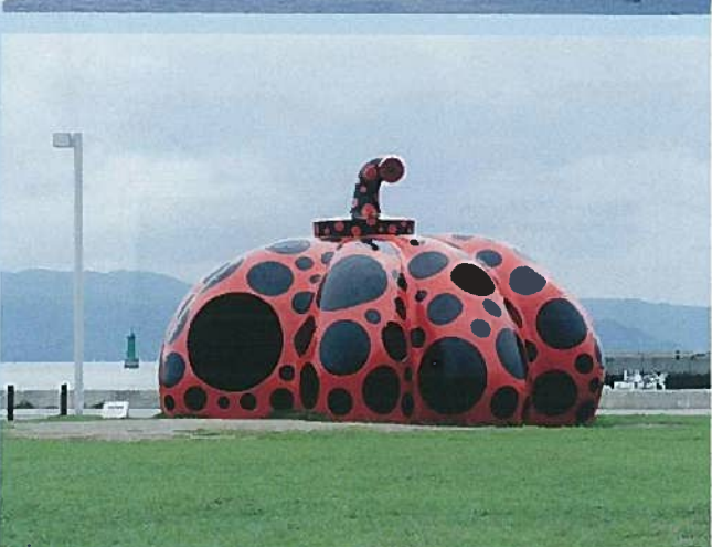
▲【直島】草間彌生「赤かぼちゃ」2006年直島・宮瀬池緑地